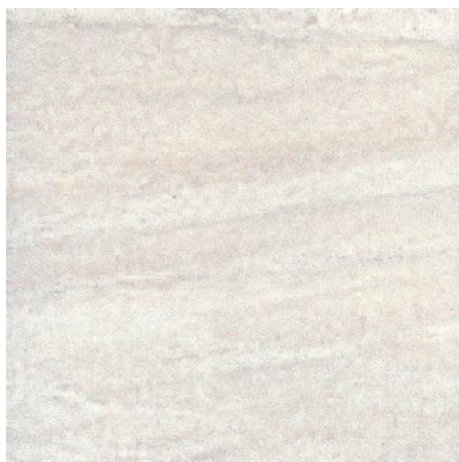
4230 Престон светлый 40,2x40,2 Preston light