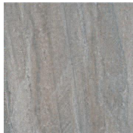
4229 Престон коричневый 40,2x40,2 Preston brown