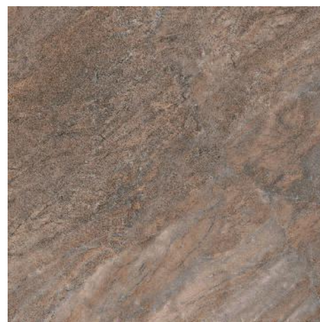
4212 Бромли коричневый 40,2x40,2 Bromley brown