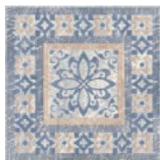
STG/D259/4215 Бромли 19,6x19,6 Bromley