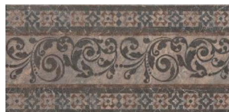
STG/A258/4212 Бромли 40,2x19,6 Bromley