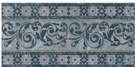
STG/C258/4214 Бромли 40,2x19,6 Bromley