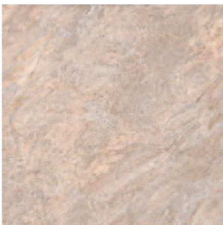
4213 Бромли беж 40,2x40,2 Bromley beige