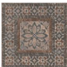
STG/A259/4212 Бромли 19,6x19,6 Bromley