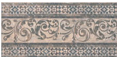
STG/B258/4213 Бромли 40,2x19,6 Bromley