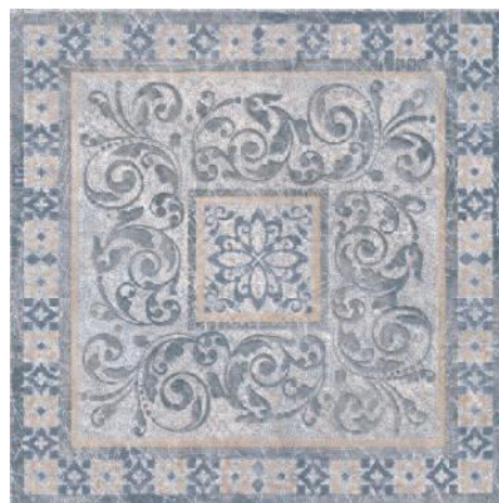
STG/D257/4215 Бромли 40,2x40,2 Bromley