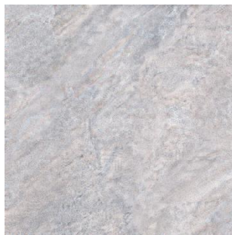
4215 Бромли серый 40,2x40,2 Bromley grey