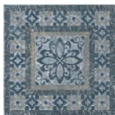
STG/C259/4214 Бромли 19,6x19,6 Bromley