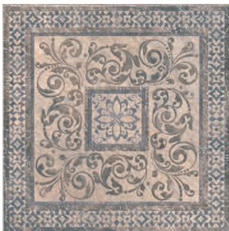
STG/B257/4213 Бромли 40,2x40,2 Bromley