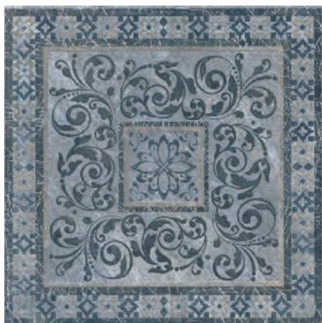
STG/C257/4214 Бромли 40,2x40,2 Bromley