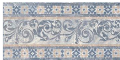
STG/D258/4215 Бромли 40,2x19,6 Bromley