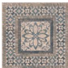
STG/B259/4213 Бромли 19,6x19,6 Bromley