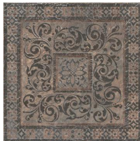
STG/A257/4212 Бромли 40,2x40,2 Bromley