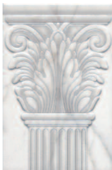
STG/A409/1/8248 Вилла Юпитера капитель 20x30 Villa Jovis capital