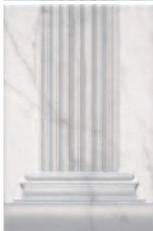
STG/A409/3/8248 Вилла Юпитера основание 20x30 Villa Jovis base