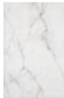
8248 Вилла Юпитера белый 20x30 Villa Jovis white