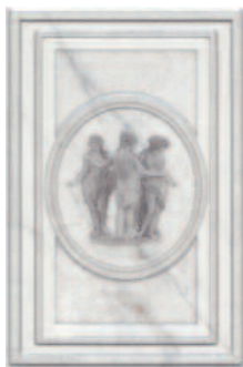
STG/A471/8248 Вилла Юпитера 20x30 Villa Jovis