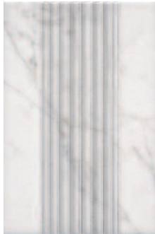
STG/A409/2/8248 Вилла Юпитера колонна 20x30 Villa Jovis column