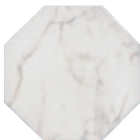
SG240400N Сансеверо белый 24x24 Sansevero white