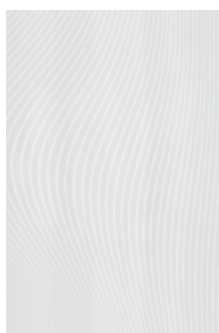
8249 Маронти светлый 20x30 Maronti light