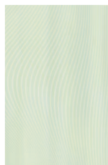
8251 Маронти зелёный 20x30 Maronti green