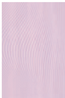
8250 Маронти розовый 20x30 Maronti pink