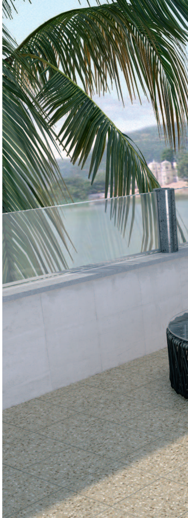
3405 Шельф серый 30,2x30,2 Shelf grey

Рекомендуем применять затирку, одинаковую по цвету с плиткой; при использовании контрастной – провести пробу на небольшом участке и убедиться, что поверхность легко очищается. Если имеет место окрашивание, обработать поверхность защитными средствами. Подробнее – www.kerama-marazzi.com / Советы / Уход за керамической плиткой.