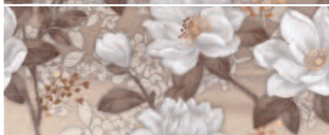
7114/A/B/3F Жасмин панно из двух частей 20x50 (размер каждой части) Jasmine panel