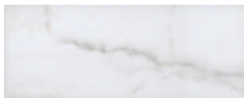
7108 Лакшми белый 20x50 Lakshmi white