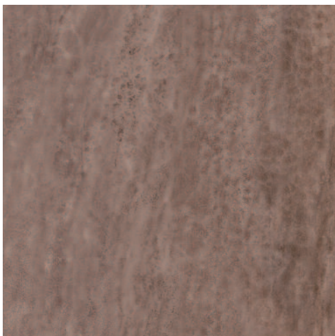
SG455800N Лакшми коричневый 50,2x50,2 Lakshmi brown