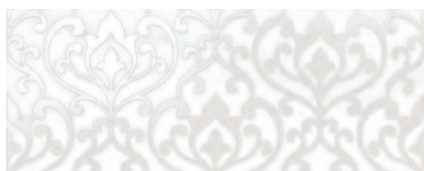
STG/A88/7108 Сари 20x50 Saree