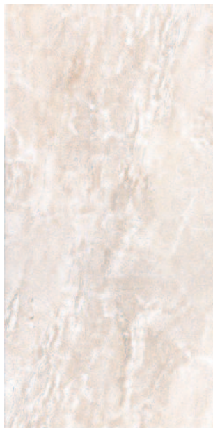
11052 Махарани 30x60 Maharani