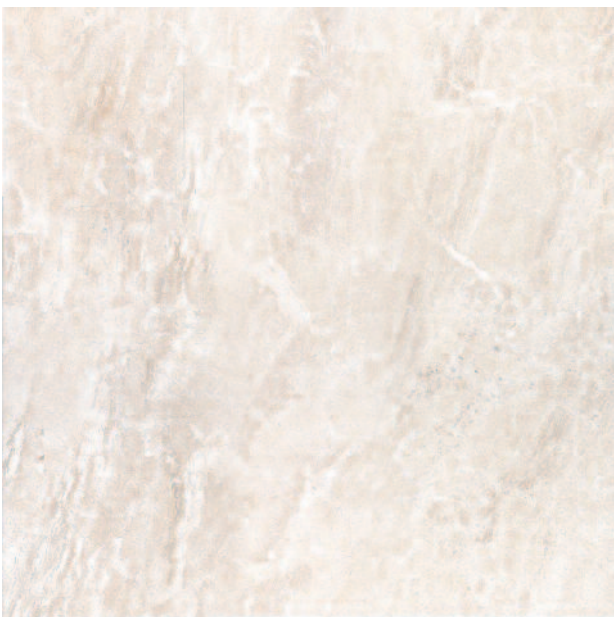
SG615200R Аравали беж обрезной 60x60 Aravali beige rectified