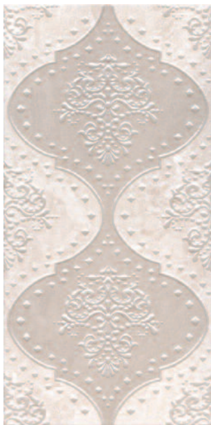
AR114/11052 Махарани 30x60 Maharani