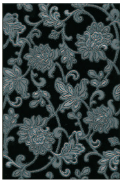
STG/A41/8141 Аджанта 20x30 Ajanta