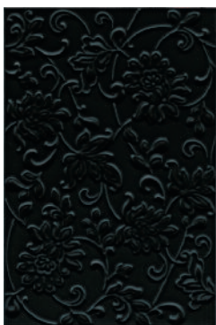
8217 Аджанта цветы черный 20x30 Ajanta flowers black