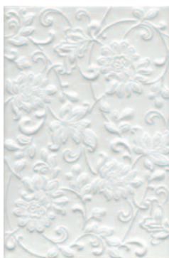
8216 Аджанта цветы белый 20x30 Ajanta flowers white