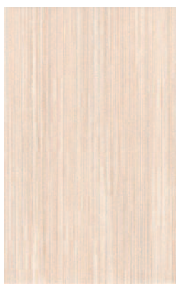
6222 Агатти беж 25x40 Agatti beige