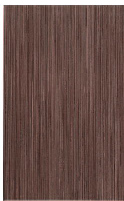
6173 Палермо коричневый 25x40 Palermo brown