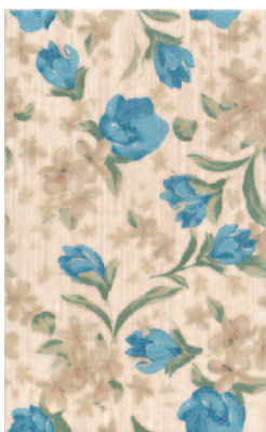
DT/A69/6222 Агатти 25x40 Agatti